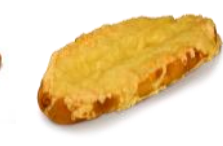
Käse-Laugen Laugenstange mit Gouda überbacken