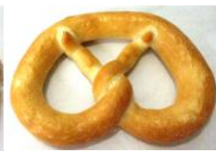
Breze weiß Weißbrotbreze