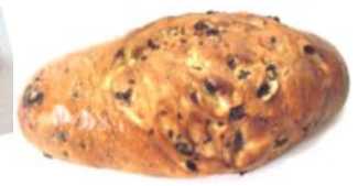
Weinbeerwecken Weizengebäck mit Weinbeeren