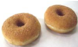
Donuts Hefengebäck mit Zimt-Zucker