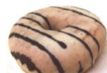
Puddingdonut gefüllt mit Vanillepudding, glasiert