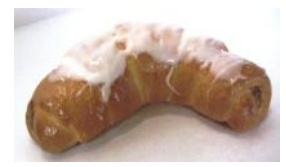
Nuß-, Mohnkipferl Hefeteiggebäck mit Haselnuß- oder Mohnfülle, Zuckerglasur