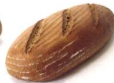
Roggi 500g 100% Roggenbrot, mit Natur-Sauerteig