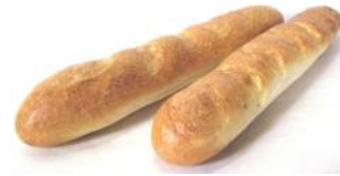
Baguette 250g, 500g Weizenbrotstange