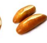
Mini-Laugen Mini-Gebäck ohne Dekor-Salz