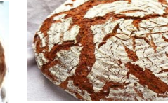
Fimba Brot 500g Mischbrot aus Urgetreidesorten, mit Dinkelsprossen