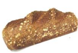
Joghurtbrot 500g Helles Kornbrot mit Natur- joghurt, Sonnenblumenkerne, Sesam, Hafer