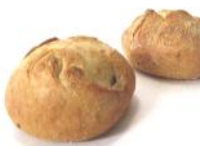
Wachauer 100g Weizen/Roggenlaibchen mit Kümmel, Sauerteig