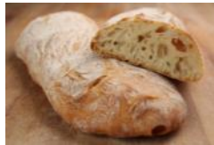
Ciabatta 250g Ital. Weizenbrot mit Bio-Olivenöl