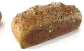
Nikolauser 500g Sesam, Leinsaat, Sojaschrot, Sonnenblumenkerne, Haferflocken, Roggen-, Weizenschrot