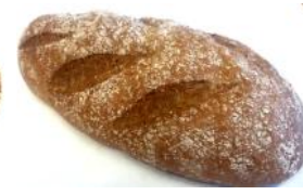
Keimlingbrot 500g Rustikales Keimlingsbrot mit Malz