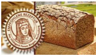
Hildegardbrot 500g Dinkelbrot nach Hildegard v. Bingen mit Naturjoghurt, Hafer, Sesam