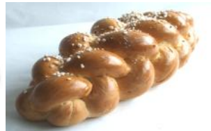
Hefezopf 500g, 250g mit Hagelzucker oder Mandeln bestreut