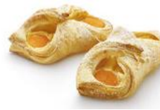
Marillentasche Plundergebäck mit Marillen und Vanillecreme