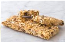
Müsliriegel Power-Riegel mit Hafer, Sesam, Sultaninen, Mandeln, Honig, Sonnenblumenkerne