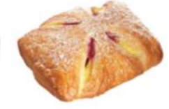
Himbeer-Vanilletasche Plundertasche mit Vanillecreme, Himbeeren