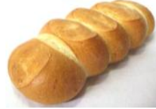
Zeile 250g Weizenbrotstengel 5teilig