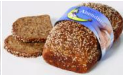
Abendbrot 500g Viel Eiweiß, wenig Kohlenhydrate