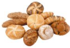
Jourgebäck 25g Kleingebäckmischung