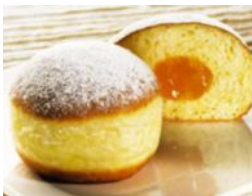
Krapfen (Berliner) Siedegebäck mit Marillenmarmelade