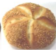
Sesamsemmel Weizengebäck mit Sesam