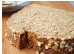
Haferbrot 500g Helles Hafer-Weizenmischbrot, Haferflocken