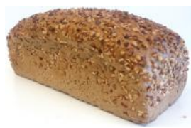
Nussbrot 500g Roggenschrot, Weizenschrot, Walnüsse, Gewürz