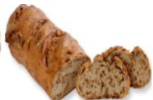
Speckweckerl Weizen/Roggenweckerl mit Kümmel, Sauerteig, Tiroler Speckwürfel