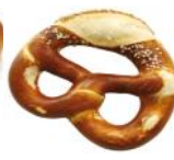
Laugenbreze mit Salz bestreut