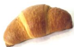
Schokocroissant Butter-Croissant mit Schokolade gefüllt