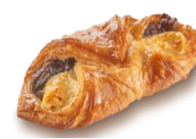
Max und Moritz Hefengebäck mit Mohn-, Topfenfüllung