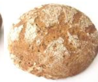
Bauernlaib 500g Roggenmischbrote mit Natur-Sauerteig, Kümmel, Koriander, Fenchel