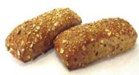
Joghurtriegel Rustikales Korngebäck mit Naturjoghurt, Hafer, Sesam, Sonnenblumenkerne