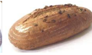
Kürbiskernbrot 500g Kornbrot mit Sesam, steirischen Kürbiskernen