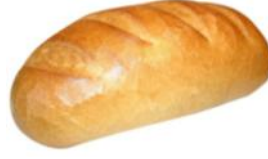
Weißbrot 250g, 500g Weizenbrotwecken