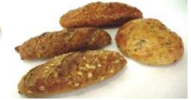
Kornspitz, gemischt Diverse Kornbrötchen gemischt