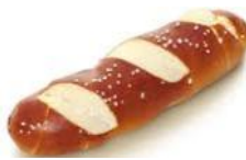
Laugenstange Weizengebäck belaugt, Dekor-Salz, auf Wunsch ohne Salz