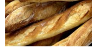
Topfenbaguette 250g Weizenbrotstange mit Tiroler Topfen