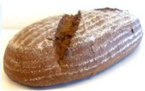
Vesulbrot 500g Mit den alten Getreidearten: Emmer, Einkorn, Kamut