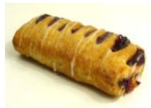
Kirsch-Vanilletasche Blätterteigtasche mit Kirsch-Vanillefüllung