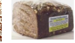
Dinkelschnittbrot Dinkel-Vollkornbrot ohne Weizen, geschnitten, mit Natur- sauer, Buttermilch, Sonnen- blumenkerne