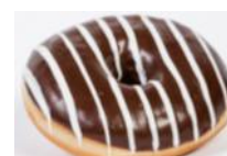
Nougatdonut gefüllt mit feiner Nougatcreme, glasiert