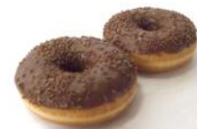
Schokodonuts gefüllt und überzogen mit Milchschokolade