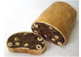
Zelten 1kg, 500g Nüsse, Rosinen, Feigen, Rum, Roggen, Weizen, Natursauerteig, Gewürze