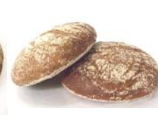
Südtiroler Paarl 230g Roggenmischgebäck, mit Natur-Sauerteig, Fenchel, Kümmel, Brotklee