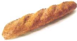
Dinkelbaguette 250g Dinkelvollmehl, Sesam, Leinsaat, Weizen, Roggen, Dinkelgrieß