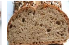
Krustenbrot 500g Kornbrot mit Hafer, Sesam, Kürbiskerne, Sonnenblumenkerne