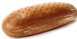
Schwarzbrot 500g, 1kg Mischbrot aus Roggen und Weizen, mit Natur-Sauerteig und Brotgewürz