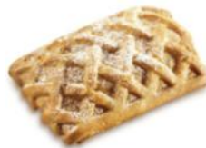
Apfel-Topfen-Schnitte mit saftiger Apfel- und Topfen(Quark)füllung