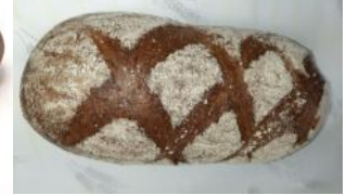
Buchweizen-Dinkel 500g Dunkles Kornbrot mit Buchweizen, Roggen-, Dinkelmehl