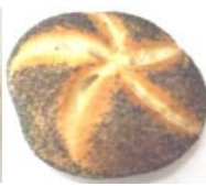
Mohnsemmel Weizengebäck mit Blaumohn