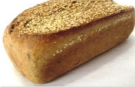
Sechskorn 750g Helles Kornbrot mit sechs verschiedenen Körnern