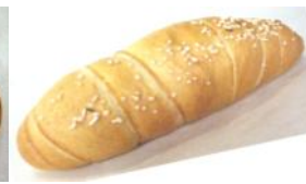
Salzstange Weizengebäck mit Salz