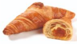
Marillen-Croissant, Vanille-Croissant mit Marillen oder Vanillefüllung