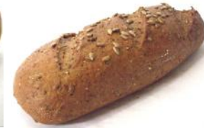
Sonnenblumenbrot 500g Leichtes Kornbrot mit Sonnenblumenkerne